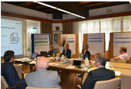
Sitzungsvorbereitung mit LAG-Beirat

Besonders Projekte im Bereich Kultur und Tourismus, sowie