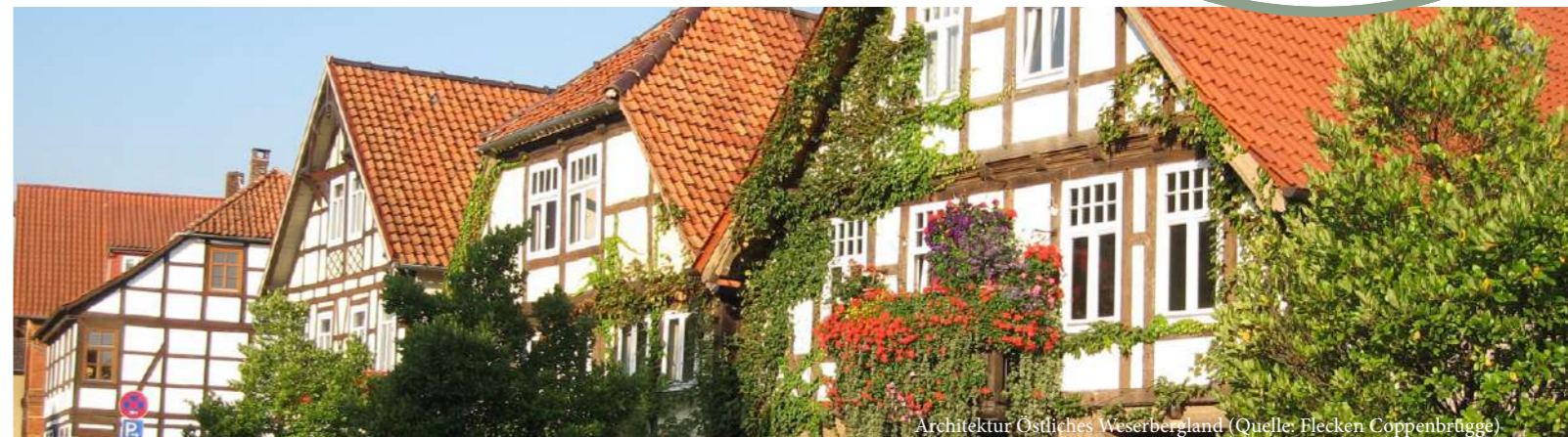
Architektur Östliches Weserbergland

Zur Vorbereitung auf die neue Förderperiode haben die Regionen aus dem Weserbergland plus eine gemeinsame Fortbildungsreihe zu den Trendthemen der Regionalen Entwicklung durchgeführt. Darüber bereiteten sich LAG-Mitglieder und weitere Akteure auf die bevorstehenden Themen und Aufgaben vor. (Themen, siehe Projektkarte Seite 8, 9)