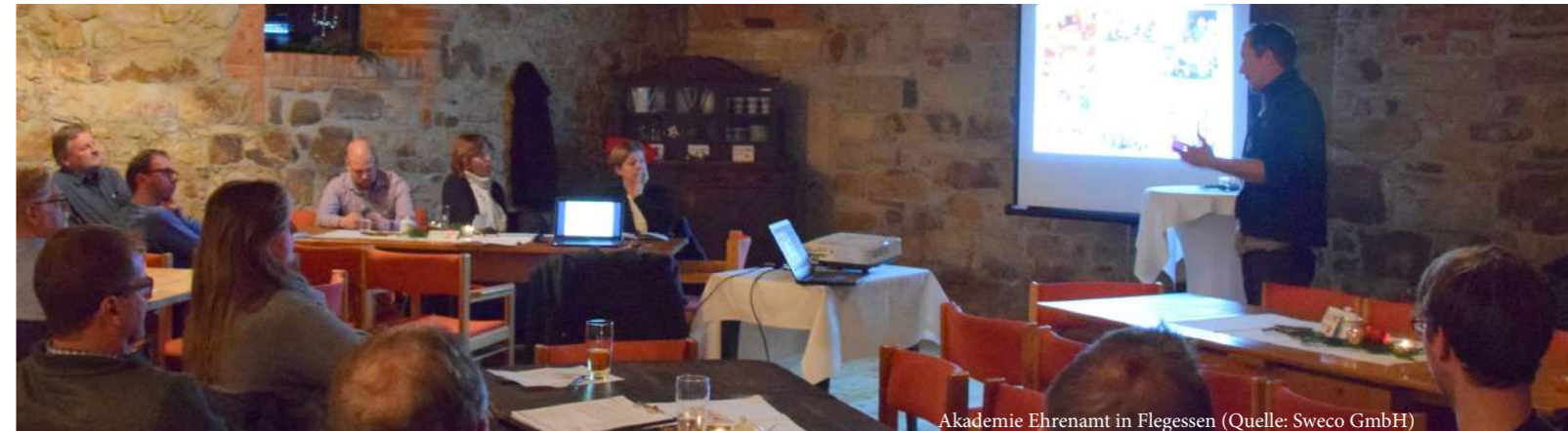
Akademie Ehrenamt in Flegessen