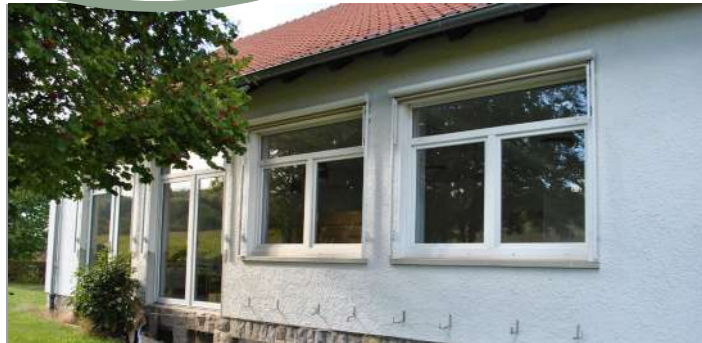
DGH in Thal