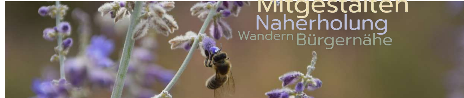
Impression aus der LEADER-Region

Zukunftskonzepte Radfahren Weiter so! Neue Chancen! Zusammenarbeit mit den Nachbarregionen starke Dorfgemeinschaften Gemeinschaft weiterhin stark mit LEADER! lebenswerte Region Kooperation Mitgestalten Naherholung Wandern Bürgernähe