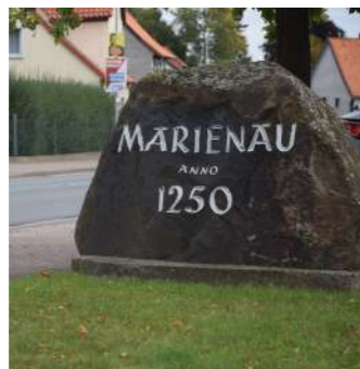
Zukunftskonzept Region Coppenbrügge & Marienau