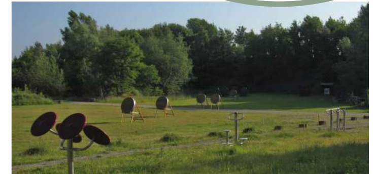
Freizeitanlage „Ithkopf“