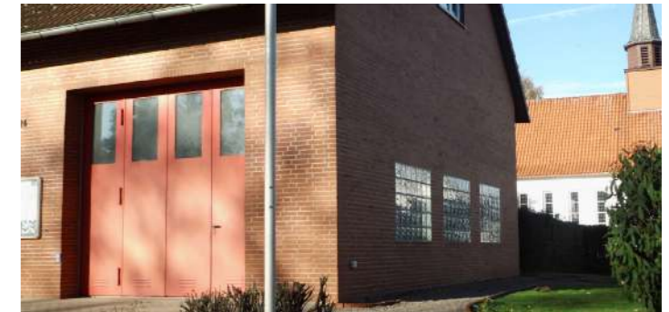
DGH Diedersen

Die Dorfgemeinschaften mit dem ehrenamtlichen Engagement der BürgerInnen sind ein wichtiger Motor der Regionalentwicklung, ein zentraler Anker für die ehrenamtlichen Tätigkeiten vor Ort wiederum stellen die Dorfgemeinschaftshäuser als Treffpunkte dar. Diese gilt es neu zu schaffen oder für die Zukunft fit zu machen, sei es durch Maßnahmen zur Instandsetzung, zur barrierefreien Nutzung, die energetische Sanierung oder dem Ausbau von Nutzungsmöglichkeiten. Nicht nur die Gebäude selbst, auch die Außenanlagen strahlen mit der Unterstützung durch LEADER-Mittel in neuem Glanz - für weiterhin starke Dorfgemeinschaften in der Region.