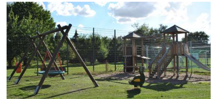
Spielplatz Hajen