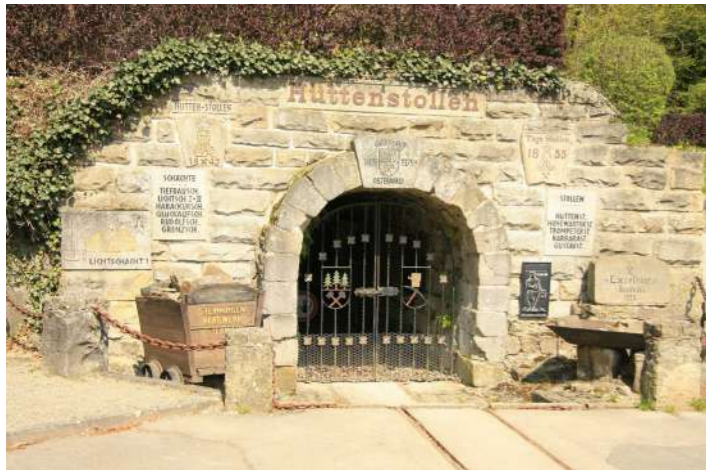
Hüttenstollen Osterwald

Als Ankerpunkte für den Tourismus, die Geschichte und die Identität der Region leistet die LEADER-Region einen Beitrag, um die historischen Anlagen wie Burgen, Stollenanlagen, Gradierwerke, Aussichtstürme genauso wie Friedhofskapellen baulich zu erhalten. Und auch an der weiteren Erforschung und Darstellung der Geschichte ist LEADER beteiligt und unterstützt das glasarchäologischen Projekt „Ehemalige Glashütte Klein Süntel“ bei einer Machbarkeitsstudie für eine anschließende kulturhistorisch seriöse wie attraktive Gestaltung des Grabungsareals.