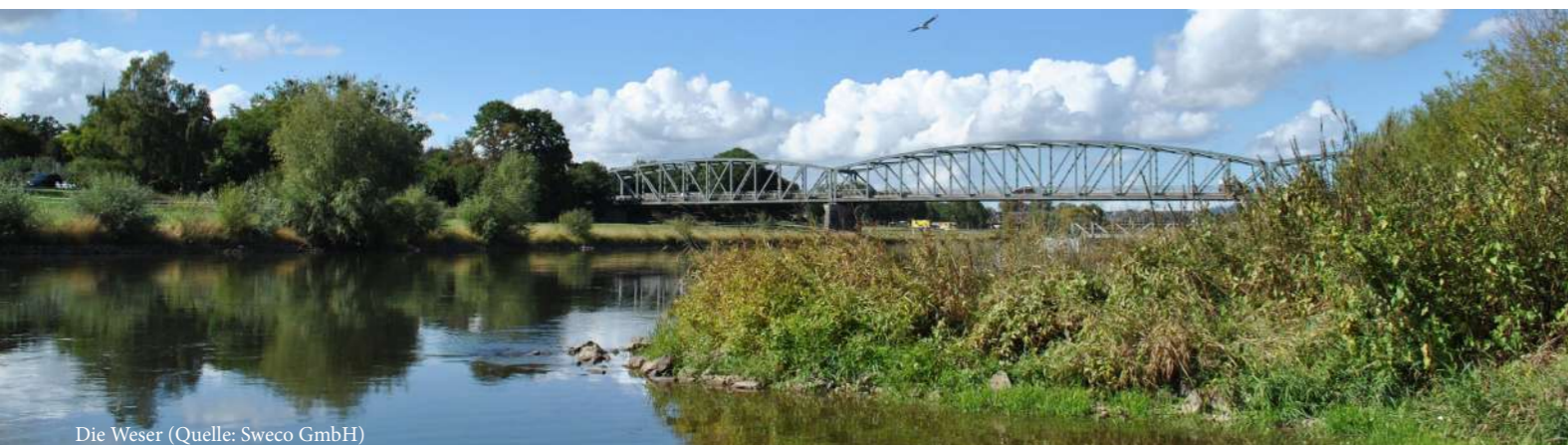
Die Weser