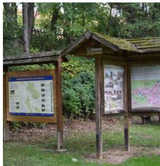
Naturpark Weserbergland