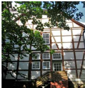
Pfarrhaus Flegessen

Neues Leben in Bestandsgebäuden einhauchen - das schafft nicht nur einen Mehrwert für die Dorfgemeinschaft, sondern auch für das Ortsbild. Im denkmalgeschützten Pfarrhaus in Flegessen erhält mit Unterstützung von LEADER-Mitteln ein Mehrgenerationen-Wohnprojekt Einzug, hier leben junge Familien und SeniorInnen unter einem Dach. In Bisperode entsteht derweil ein Multifunktionsgebäude für ein vitales und lebendiges Gesellschafts- und Vereinsleben. Geplant ist auch ein Medi-Zimmer für die medizinische Erstversorgung, was gleichzeitig einen wichtigen Beitrag zur Daseinsvorsorge darstellt.