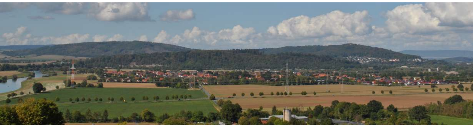
Blick ins Weserbergland