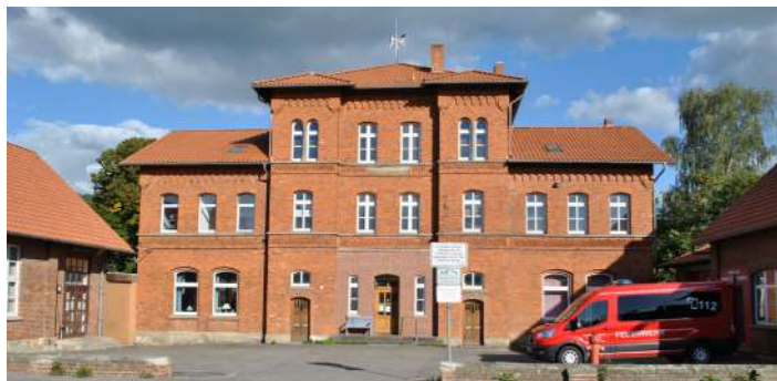
Multifunktionsgebäude Bisperode