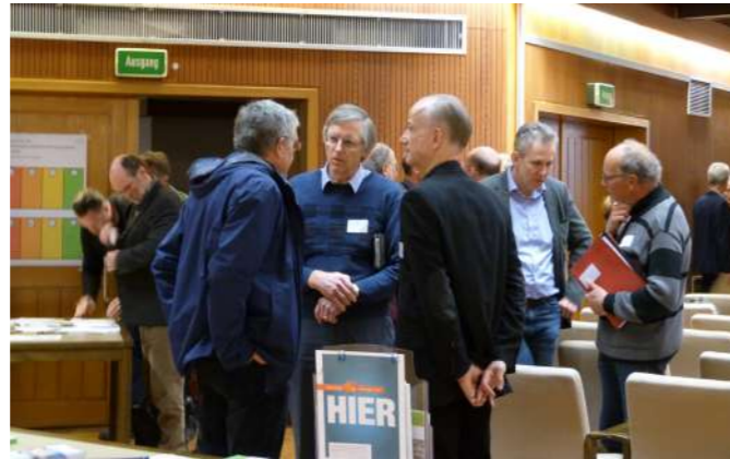
LEADER-Forum 2018 in Emmerthal

In der Förderperiode 2014 – 2020 und den zwei zusätzlichen Jahren Übergangszeit bis 2022, konnten in der LEADER-Region Östliches Weserbergland zahlreiche Projekte zur Entwicklung der ländlichen Region realisiert werden. Die Umsetzung dieser Vorhaben stand unter dem Leitbild „Östliches Weserbergland – Zukunft gemeinsam bewegen“. Die interkommunale Zusammenarbeit stellt einen wichtigen Faktor im notwendigen Wandel und der damit zusammenhängenden zukunftsfähigen Gestaltung des ländlichen Raumes dar. Mithilfe des Budgets der LEADER-Förderung, welches in der vergangene Förderperiode voll ausgeschöpft werden konnte, wurden mehr als 50, der in den Handlungsfeldern geplanten Projekte realisiert. Ferner hat die Region für die Übergangsgestaltung zur neuen Förderperiode zusätzliche Mittel erhalten, sodass auch über LEADER hinaus weitere innovative Vorhaben umgesetzt werden konnten.