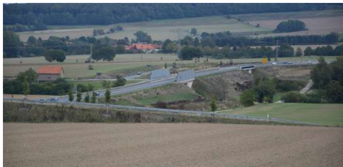
Ortsumgebung Coppenbrügge / Marienau