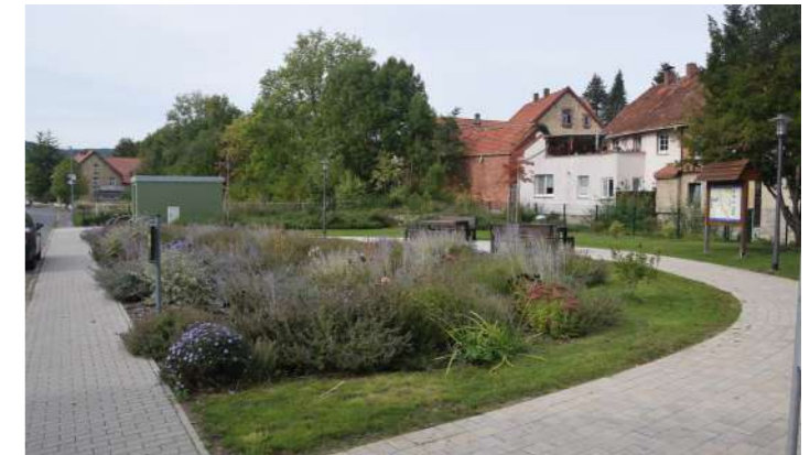
Glockseegarten Wallensen