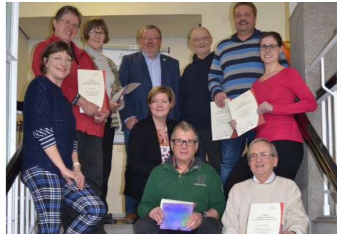
Engagementlotsen im Landkreis Hameln-Pyrmont

Doch was tun, wenn man im Ehrenamt nicht mehr weiterkommt; wenn es an Ideen oder gar UnterstützerInnen fehlt? Hier setzt die Freiwilligenakademie Niedersachsen mit ihrem Zertifikatslehrgang „Engagementlotse“ an. Ziel ist es engagierte BewohnerInnen auszubilden, die für das Ehrenamt im Dorf unterstützend tätig werden können. Sie lernen in den unterschiedlichsten Situationen den Engagierten Hilfestellung zu geben, können auf ein Netzwerk von Akteuren zugreifen und so für frischen Wind, neue Ideen und Unterstützung sorgen. An dem Lehrgang, den die LEADER-Regionen Östliches und Westliches Weserbergland nach Hameln geholt haben, nahmen sieben Engagementlotsen erfolgreich teil. Sie haben vor allem Themen wie Teamarbeit, Kommunikation, Projektmanagement und Netzwerkarbeit bearbeitet und damit „Werkzeuge“ an die Hand bekommen, mit denen sie für ihr Anliegen gewappnet sind.