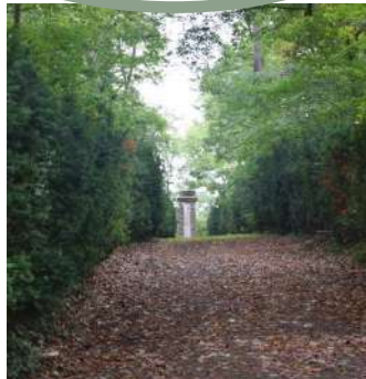
Wanderwege im Weserbergland