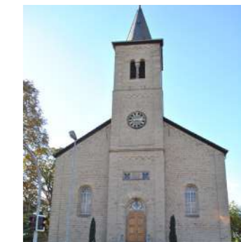
OT Grohnde

Umbau statt Zuwachs 2 Im Modellprojekt „Umbau statt Zuwachs“ (MUZ) des Nds. Landwirtschaftsministeriums haben 17 Städte und Gemeinden aus der REK Weserbergland plus -Region in einem dreijährigen Kooperationsprozess (2010-2012) Handlungsansätze und Umbauprozesse einer aktiven Innenentwicklung entwickelt sowie erste Maßnahmen begonnen. Der eingeschlagene Weg soll im Rahmen des Folgekooperationsprojekts konsequent weiter verfolgt werden und über die Umsetzung von drei Bausteine erfolgen: 1. das Netzwerk „Aktive Innenentwicklung“ (unterstützt durch LEADER-Förderung) für die Weiterentwicklung und den Wissenstransfer im Projekt, 2. die fachplanerische Umsetzungsbegleitung von Projekten sowie 3. das Unterstützungsbudget „Tatort Dorfmitte“ zur Unterstützung von bürgerschaftlichen Aktivitäten und Maßnahmen zur Belebung und Attraktivitätssteigerung von Dorfkernen.