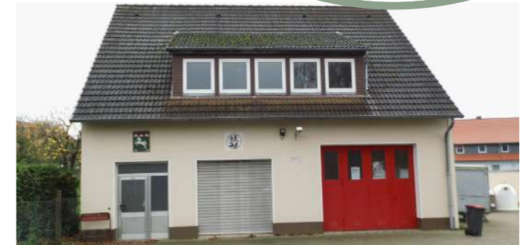
DGH Dörpe