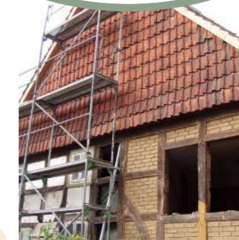
Historisches sanierungsbedürftiges Gebäude

Baukulturdienst Weser-Leine Der Baukulturdienst Weser-Leine (BKD) als LEADER-Kooperations-Projekt der Landkreise Schaumburg, Hameln-Pyrmont, Holzminden und Hildesheim wendet sich an EigentümerInnen und BewohnerInnen regionaltypischer sowie ortbildprägender Gebäude und bietet eine unabhängige Beratung zur Aufwertung und Sicherung der Bausubstanz. Dies stärkt den Erhalt der Gebäude und ein gepflegtes Ortsbild als Grundlage einer touristischen Entwicklung. Zudem steigt die regionale Wertschöpfung durch die Vergabe von Aufwertungsmaßnahmen an örtliche HandwerkerInnen. Für diese werden zudem vom Projektträger, der bundesweit agierende IG Bauernhaus e.V. mit der Beratungsstelle in Apelern-Soldorf (Landkreis Schaumburg), zusätzliche Weiterbildungen angeboten.