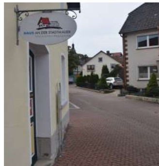
DGH Wallensen