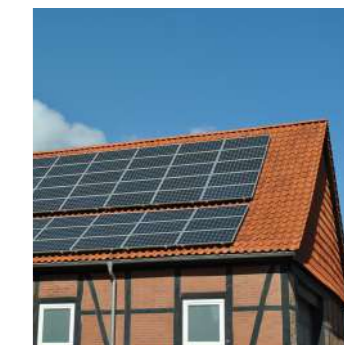
Solarenergie im Östlichen Weserbergland

Solarkampagne Die Landkreise Schaumburg, Hameln-Pyrmont und Holzminden haben sich mit dem Projekt „Masterplan 100% Klimaschutz“ das Ziel gesetzt, die Treibhausgasemissionen zu reduzieren. Die Klimaschutzagentur Weserbergland setzt genau da an und legt das Hauptaugenmerk auf die Solarenergie zur Strom- und Wärmeerzeugung. Um die Anzahl entsprechender Anlagen zu erhöhen, wird die Öffentlichkeit mit der Solarkampagne „Sonnenszeit“ informiert und sensibilisiert. Von Beratungsangeboten für Gebäudeeigentümer, Qualifizierungsangeboten für Solarberater und Planungsbüros, der Vernetzung von Anbietern, Unterstützern sowie Initiatoren bis hin zu weiteren Öffentlichkeitsarbeiten reichen die Bausteine der Solarkampagne. Ein erfolgreiches Kooperationsprojekt mit den benachbarten LEADER-Regionen Westliches Weserbergland und VoglerRegion.