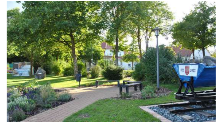
Kommunikationsinseln in Salzhemmendorf

Und auch an die jüngsten BewohnerInnen ist gedacht. Ob neue Spielplätze oder wenn es heißt „Aus Alt mach Neu“ - einladende Orte zum Toben, Spielen und Treffen für Kinder und Jugendliche sind eine Herzensangelegenheit der LEADER-Region Östliches Weserbergland.