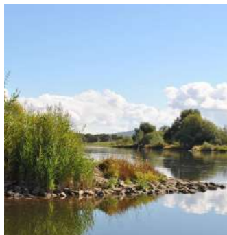
Die Weser

Konzept kommunaler Wanderwege im Naturpark Weserbergland Durch drei vom Deutschen Wanderverband als „Lange Qualitätswege“ zertifizierte Fernwege lädt der Naturpark Weserbergland bereits zum Wandern und Radfahren ein. Auf diese Qualitäten aufbauend hat der Zweckverband Naturpark Weserbergland gemeinsam mit zahlreichen und zentralen Partnern wie den Landkreisen Schaumburg und Hameln-Pyrmont, 18 Städten, Gemeinden und Samtgemeinden, 6 Touristikzentren aus der Region, Ehrenämtern aus Vereinen, den wichtigsten Grundeigentümern und einem externen Dienstleister ein Konzept für die weitere Aufwertung der Rund- und Tageswanderwege erarbeitet. Der Fokus liegt hier auf der Steigerung der Qualität der Wander- und Radwanderwege, nicht der Quantität – ganz nach dem Motto „Weniger ist mehr“.