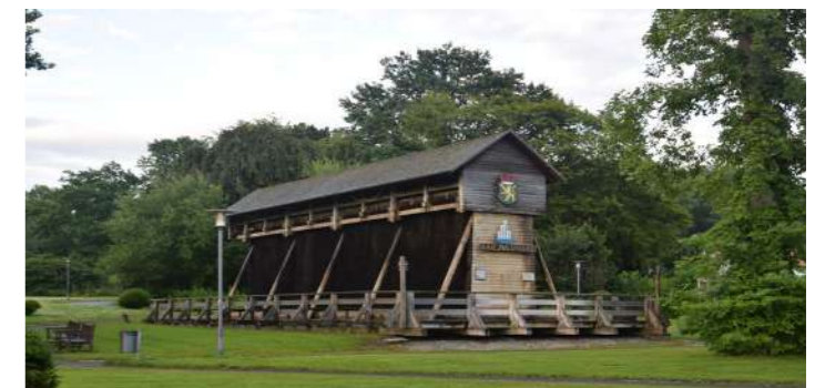
Gradierwerk Bad Münden