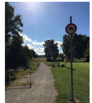
Rad- und Fußweg Salzhemmendorf-Duingen