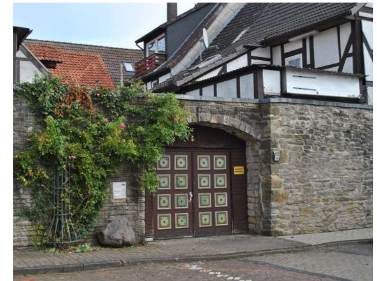
Stadtmauer Bad Münster