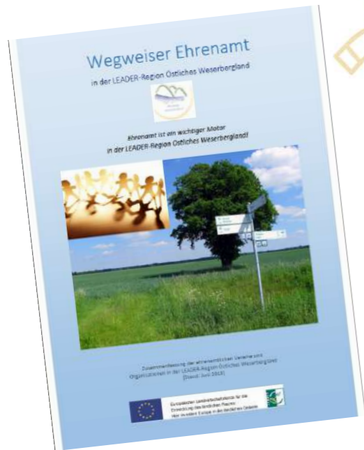
Wegweiser Ehrenamt Östliches Weserbergland