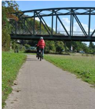
Radwege im Weserbergland

Der Tourismus stellt in der LEADER-Region Östliches Weserbergland einen wesentlichen Wirtschaftszweig dar. Neben dem Erhalt, der Stärkung, Profilierung und Ausweitung bestehender Angebote kommt eine weitere, bedeutsame Aufgabenstellung hinzu: Die Herrichtung historischer Anlagen macht die einzigartige Geschichte der Region lebendig, wichtige Kulturgüter werden im Erhalt gesichert - und erlebbar. Für Naherholungssuchende und TouristInnen bietet sich eine breite Auswahl attraktiver Ausflugs- und Erholungsorte, welche die Identität der BürgerInnen mit ihrer Heimat weiter stärken und Gästen die geschichtliche Entwicklung und somit die Region selbst näherbringen.